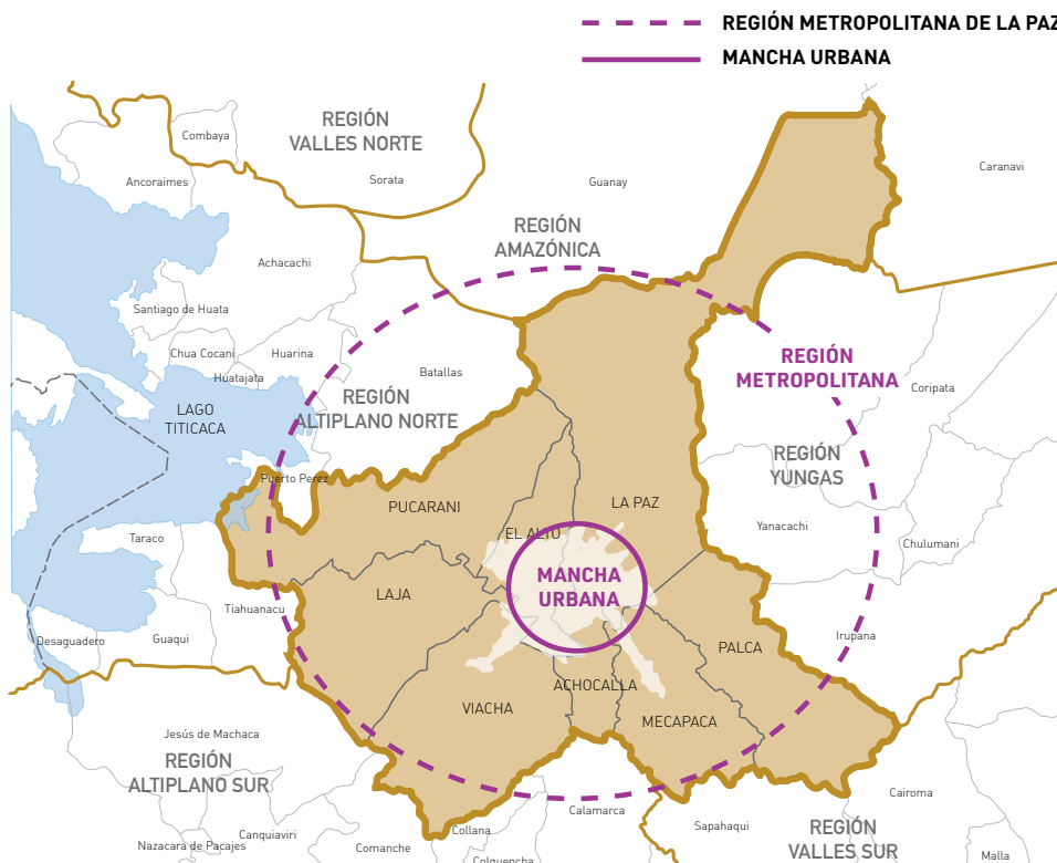
Gráfico 1: Región y área metropolitana del departamento de La Paz